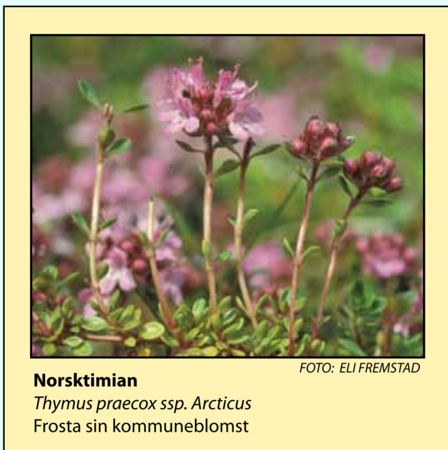
Norsktimian Thymus praecox ssp. Arcticus Frosta sin kommuneblomst

Båtbyggetradisjoner har også vært en næringsvei med røtter bakover i tid. Kunnskap er overført fra en generasjon til en annen, og i dag finnes ennå fastboende i Småland som behersker dette faget.